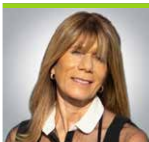
XIMENA RINCÓN, ministra de Energía