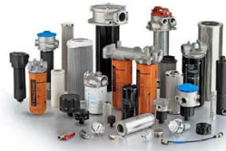
Filter desarrolla soluciones para procesos vinculados al cobre y el litio.

a resolver necesidades operacionales inmediatas de la industria minera. El sitio permite acceder a stock en tiempo real, procesos simplificados de compra y despacho prioritario directo a faena, facilitando la reposición rápida de productos Donaldson y otras marcas.