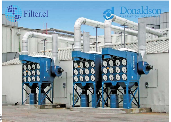
De la mano de Donaldson, Filter asegura rapidez de respuesta y soporte continuo para operaciones mineras.

En este contexto, la empresa destaca el respaldo de Donaldson, compañía con más de 110 años de trayectoria y liderazgo global en soluciones de filtración. La firma cuenta