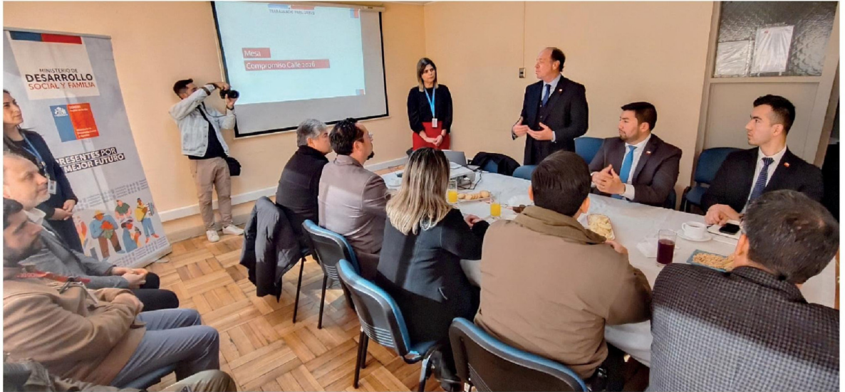
LA MESA "COMPROMISO CALLE" se desarrolló en dependencias de la Delegación presidencial provincial de Biobío.

Albergues, rutas sociales y atención médica móvil forman parte de las estrategias que se desplegarán en la provincia de Biobío para enfrentar el invierno y resguardar a personas en situación de vulnerabilidad, especialmente a quienes se encuentran en situación de calle ante la llegada de las bajas temperaturas.