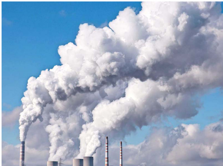
En Chile, millones de personas aún viven en ciudades donde el aire supera frecuentemente los niveles recomendados por la OMS.