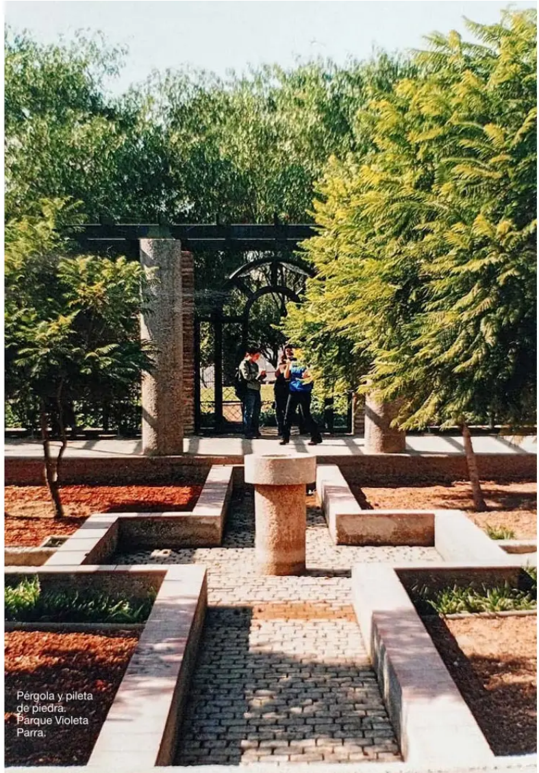
Pérgola y pileta de piedra. Parque Violeta Parra.