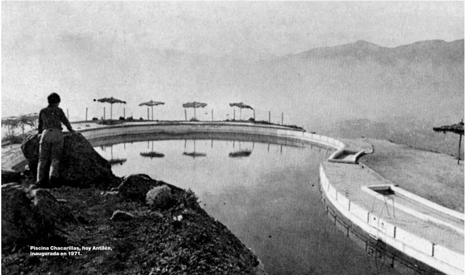
Piscina Chacarillas, hoy Antilén, inaugurada en 1971.