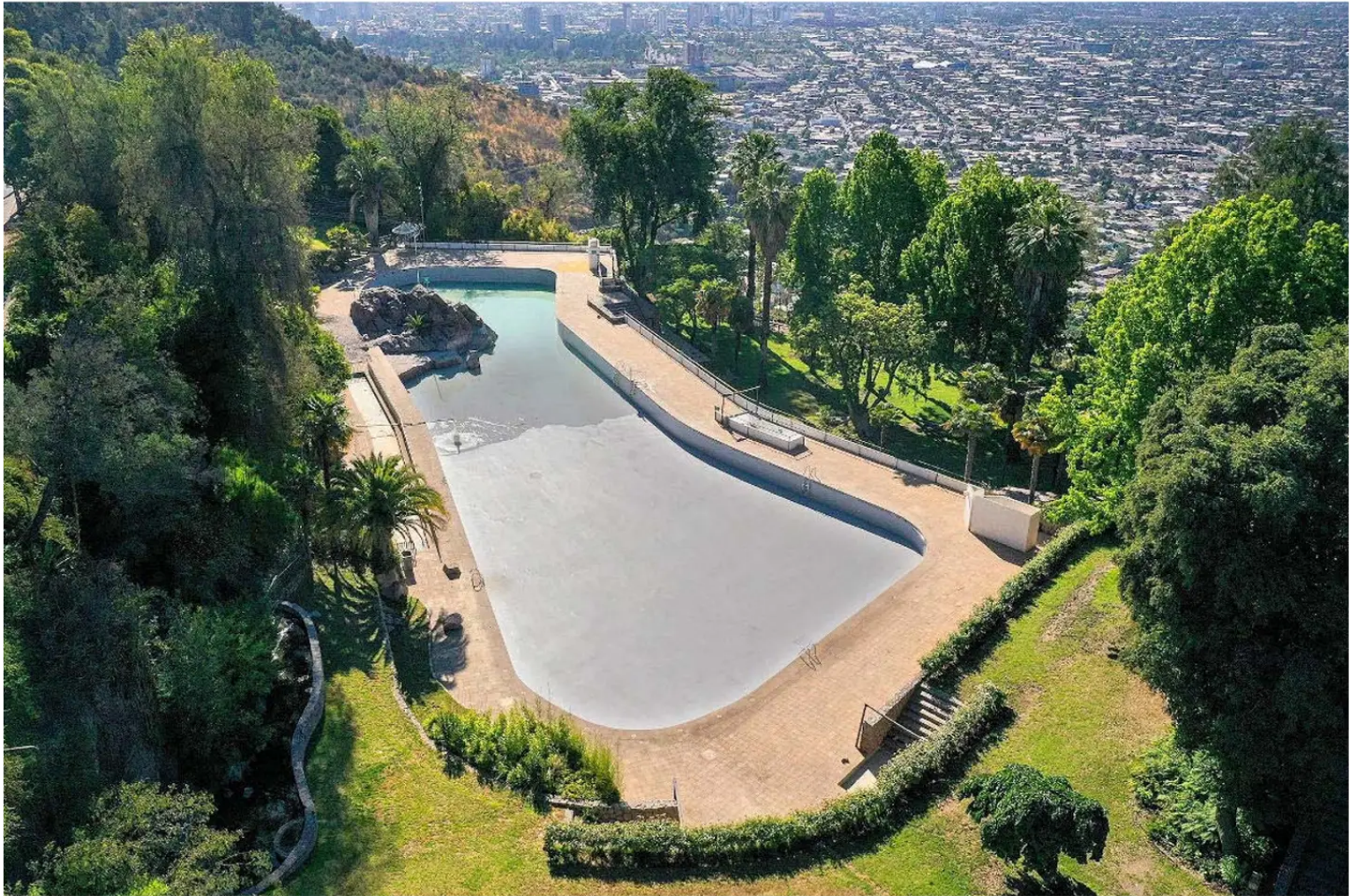
Vista aérea de Piscina Tupahue, ubicada en el cerro San Cristóbal.

a la piscina fue habilitada como estacionamiento para trescientos automóviles.