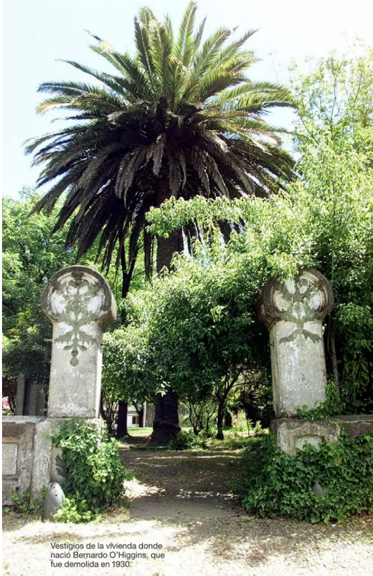
Vestigios de la vivienda donde nació Bernardo O'Higgins, que fue demolida en 1930.