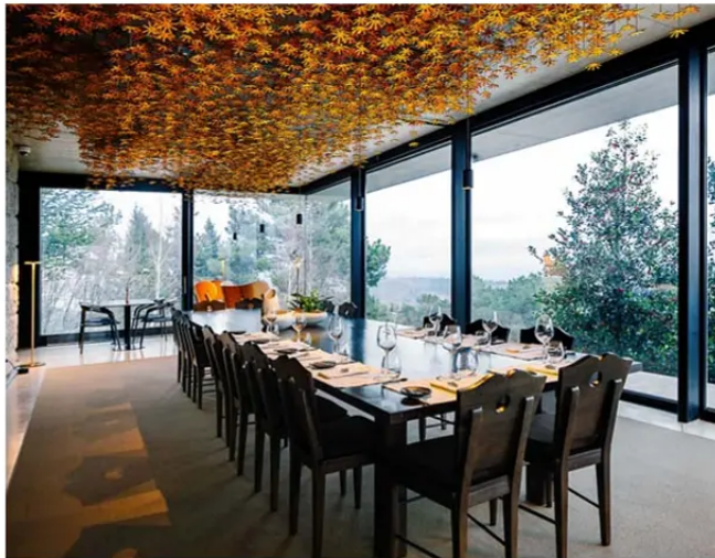
Arriba, Casa das Penhas Douradas: tradicional Queijo da Serra al desayuno, y salón de esquís antiguos. Abajo, Casa de São Lourenço: balcón y 1.200 flores de burel en su restaurante.

Nos bajamos en Nelas , un pueblito que no aparece en las listas de imperdibles.