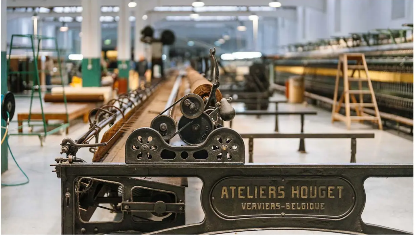
Los viejos engranajes de hierro de una máquina textil belga siguen custodiando el nacimiento del burel en el corazón de Manteigas.