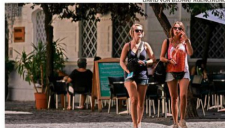
El histórico Barrio París-Londres espera visitantes.

La Asociación Gremial de Turismo y Comercio Histórico de Santiago indicó que diversos barrios abrirán sus locales el sábado y domingo. En el Barrio París-Londres, por ejemplo, destaca el restobar Londres 45, en Lastarria. Bar La Junta o Tren al Sur son opciones. También abrirán el Mercado Central, Barrio Brasil, Yungay y Bulnes.