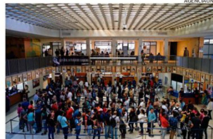
El archivo histórico en Huérfanos 1570 data desde 1885.