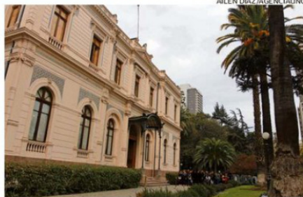
En sus jardines habrá una recreación de la Belle Époque.