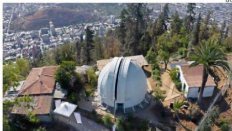
Es uno de los más antiguos del hemisferio sur.

Si la idea es conocer espacios que tal vez no concentren todas las visitas, mañana y el domingo abrirá de 11:00 a 17:00 el Observatorio Manuel Foster en Providencia. El equipo astronómico relatará la historia científica y patrimonial del primer observatorio astrofísico de Chile, declarado monumento nacional desde 2010.