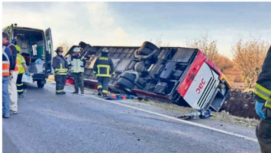
LA MÁQUINA 7810 DE BUSES JAC SE VOLCÓ EN UNA RECTA UBICADA ENTRE EL PUENTE ALLIPÉN Y EL CRUCE CUNCO.

El villarricense de 26 años que iba manejando la máquina se mantuvo en calidad de detenido, privado de libertad, hasta el mediodía de ayer, que fue llevado hasta el Juzgado de Garantía de Pitrufquén para su formaliza-