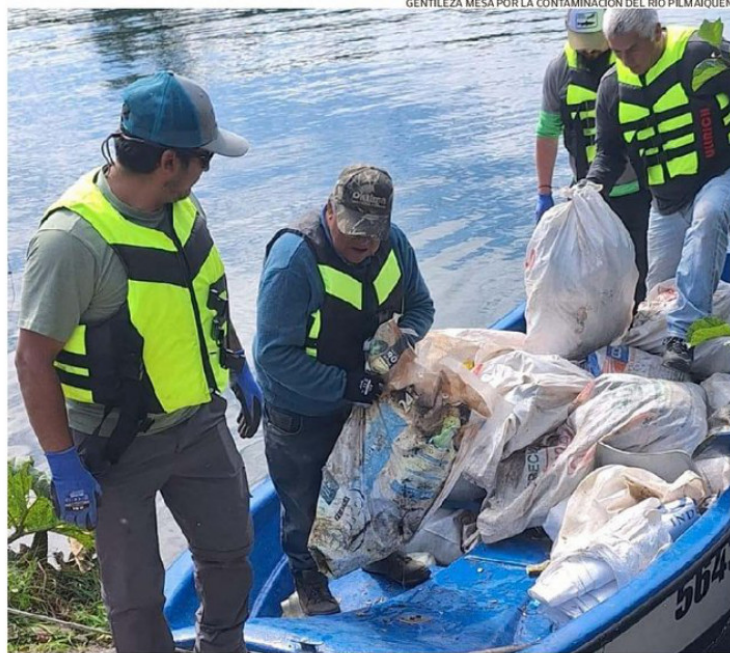
EN LA IMAGEN SE VE PARTE DE LAS ACCIONES CIUDADANAS POR DESCONTAMINAR EL RIO PILMAIQUÉN.

El sistema de alcantarillado fue construido en 1987 para abastecer a una cantidad menor de habitantes en la villa de Entre Lagos, bajo la promesa de que posteriormente se desarrollaría una segunda etapa que incluiría la construcción de una planta de tratamiento de aguas servidas. Sin embargo, aquello