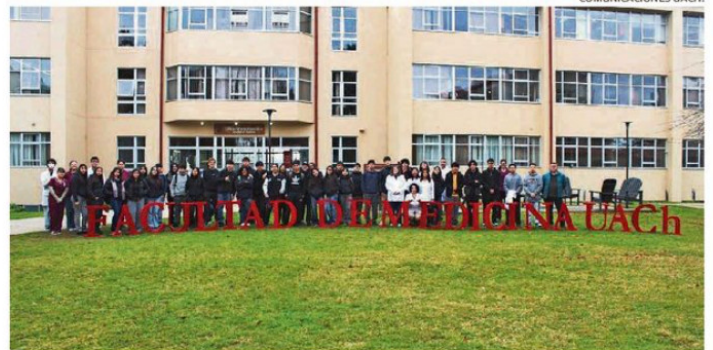
FACULTAD DE MEDICINA UACH