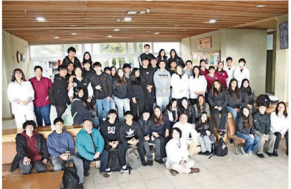
SE REALIZARON ACTIVIDADES PRÁCTICAS ORIENTADAS A ACERCAR A LAS Y LOS JÓVENES AL TRABAJO CIENTÍFICO Y A LA EXPERIENCIA UNIVERSITARIA.