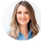
PALOMA VALENCIA CENTRO DEMOCRÁTICO Graduada en economía y derecho, milita en el partido del expresidente Uribe.

Estos indicadores se vinculan directamente a políticas de ingresos, destacando el aumento del salario mínimo, alcanzando aproximadamente los 460 dóla-