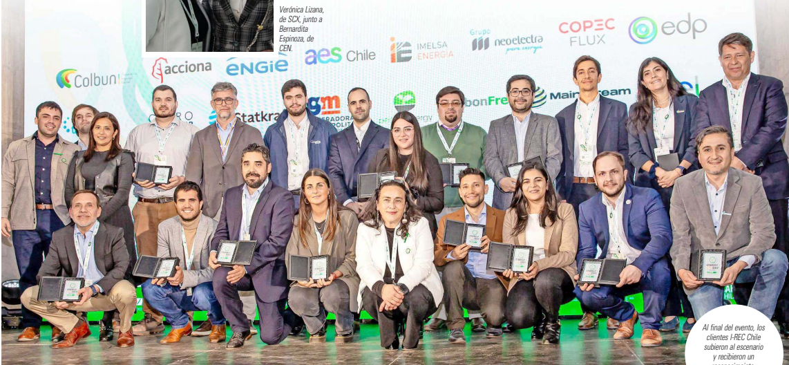
Al final del evento, los clientes I-REC Chile subieron al escenario y recibieron un reconocimiento.