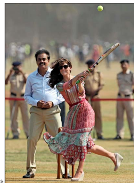
Se espera que la princesa de Gales, Kate Middleton, asista a la premiación de noviembre próximo, luego de estar dos años ausente por el cáncer que ahora está en remisión. En la foto, en 2016, cuando con el príncipe William realizó una visita oficial a India y Bután. En Mumbái, ella jugó cricket en el Oval Maidan, un histórico parque público.

Los 15 finalistas de esta sexta edición se darán a conocer en septiembre próximo y para la ceremonia final en Mumbái todavía no se ha asegurado la asistencia de la princesa de Gales, Kate Middleton, quien luego de haber sido diagnosticada con cáncer a fines de marzo de 2023, se tuvo que ausentar