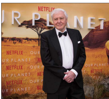
En 2019, para el estreno de la serie “Our Planet”, en el Museo de Historia Natural de Londres, sir David Attenborough. El acaba de cumplir 100 años y es parte del Consejo Asesor de los Premios Earthshot.

“Este premio es el galardón medioambiental más prestigioso del mundo”, expresó Devendra Fadnavis, ministro principal de Maharashtra, el estado donde se ubica Mumbái, “y me enorgullece anunciar que se celebrará en Mumbái en noviembre. La sostenibilidad y la acción climática siguen siendo prioridades fundamentales para Maharashtra, y el Premio Earthshot atraerá la atención mundial hacia el liderazgo y el compromiso de la India para convertir nuestros objetivos en acciones concretas sobre el terreno”.