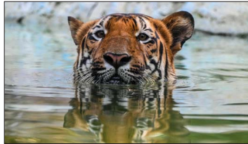
Recientemente, Jai, un tigre de Bengala (animal endémico de India), disfrutando de la piscina que tiene en Jijamata Udyaan, el zoológico de Mumbái.