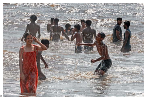
Por estos días se ha advertido una ola de calor extrema en países asiáticos como India y Vietnam, con temperaturas que rondan los 46°. En la foto, un grupo de niños refrescándose a mediados de mes en la playa de Juhu, en Mumbái. El Primer Ministro de India, Narendra Modi, instó esta semana, a través de X, a tomar tantas precauciones como sea posible ante estas temperaturas.