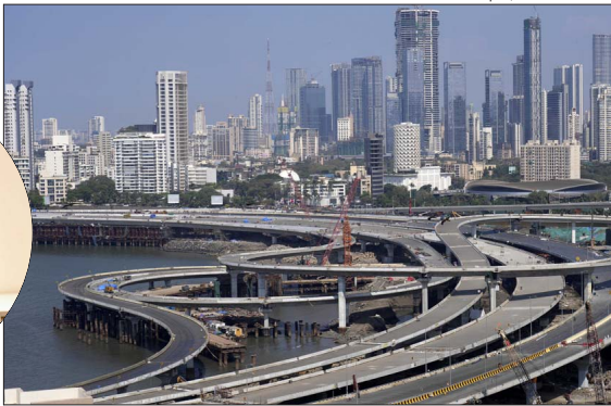
Mumbái, en una imagen de febrero de 2024. Cabe recordar que hasta 1995 la ciudad se llamó Bombay (que deriva de Bom Esaim, buena bahía en portugués). El cambio de nombre fue para recuperar su identidad local y dejar atrás el pasado colonial.

lar a los occidentales. Y es que, pese a que muchas de sus características, como la alta densidad, el clima extremo, la contaminación, la congestión vehicular, etcétera, podrían transformar a Mumbái en una ciudad que se inmoviliza en sus carencias, muy por el contrario, estas realidades son justamente el motor para crear mecanismos que la han transformado en un lugar donde todos esos temas conviven con el progreso”.