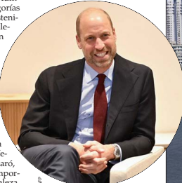
El príncipe William a mediados de mayo.