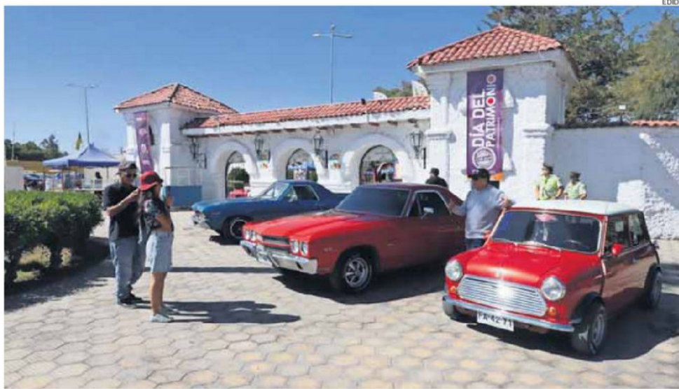
CALAMA Y LAS DEMÁS DE LAS COMUNAS DE LA REGIÓN TIENE PROGRAMADA UNA EXTENSA AGENDA DE ACTIVIDADES PARA CELEBRAR ESTE DÍA.

En la provincia, las jornadas estarán marcadas por iniciativas orientadas a relevar el patrimonio vivo, las tradiciones ancestrales y la memoria local, convocando tanto a residentes como visitantes a participar de actividades gratuitas y abiertas a toda la comunidad.