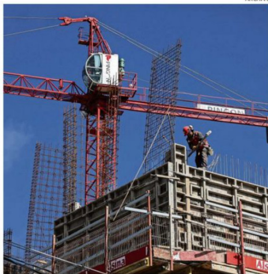
LA REGIÓN DE LOS LAGOS ALCANZÓ UNA TASA DE DESOCUPACIÓN DEL 6,8%.