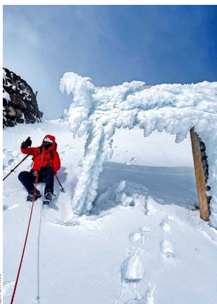
PASO. Antes de la cumbre se debe pasar por este tori, que hace de frontera entre el mundo terrenal y lo divino.

Japón no solo se respira en sus ciudades vibrantes, se siente en el silencio sagrado del monte Fuji. Para el sintoísmo, el alma de esta nación, el Fuji no es solo una montaña: es la morada de un kami , una presencia divina que exige respeto. Allí, la naturaleza no es un objeto, sino un