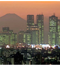
SAKURA. La floración de los cerezos es una de las grandes atracciones turísticas de Japón y ocurre en distintas ciudades. Aquí está registrado en las calles de Tokio, tal como esta vista al atardecer del Fuji, que también se puede observar desde la capital.