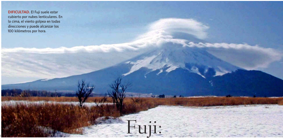
DIFICULTAD. El Fuji suele estar cubierto por nubes lenticulares. En la cima, el viento golpea en todas direcciones y puede alcanzar los 100 kilómetros por hora.