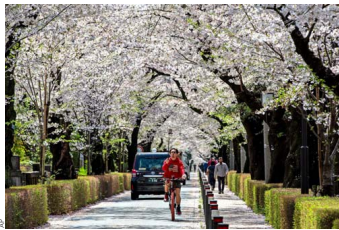
SAKURA. La floración de los cerezos es una de las grandes atracciones turísticas de Japón y ocurre en distintas ciudades. Aquí está registrado en las calles de Tokio, tal como esta vista al atardecer del Fuji, que también se puede observar desde la capital.

POR Alex Cattán*. EDICIÓN: Sebastián Montalva W.