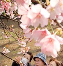
POSTAL. La ciudad de Fujinomiya es el punto de partida tradicional para hacer este ascenso, que suele comenzar desde la quinta estación del Fuji. Al lado, los cerezos.