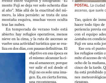
EL FUJI NO ES UNA MONTAÑA ESPECIALMENTE TÉCNICA, PERO SÍ ENGAÑOSA. Es, de hecho, una de las cumbres más ventosas del planeta en su rango de altura. Mientras buscaba información desde Chile, miraba sorprendido los informes meteorológicos: había días en que el viento alcanzaba los 100 kilómetros por hora, y las temperaturas mínimas en la cima eran de hasta 20 grados Celsius bajo cero. Con esas condiciones, el Fuji no era para nada un sitio para la improvisación.

La explicación no responde a un único factor, sino a una combinación precisa: la interacción entre la corriente cálida de Kuroshio y la fría de Oyashio, que cargan la atmósfera de energía; su condición de montaña aislada, sin barreras naturales;