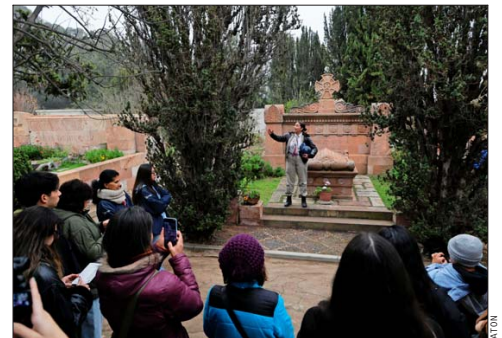
El Cementerio Santa Inés abrió sus puertas en Viña del Mar con recorridos por sus espacios históricos, destacando relatos y personajes de la ciudad.