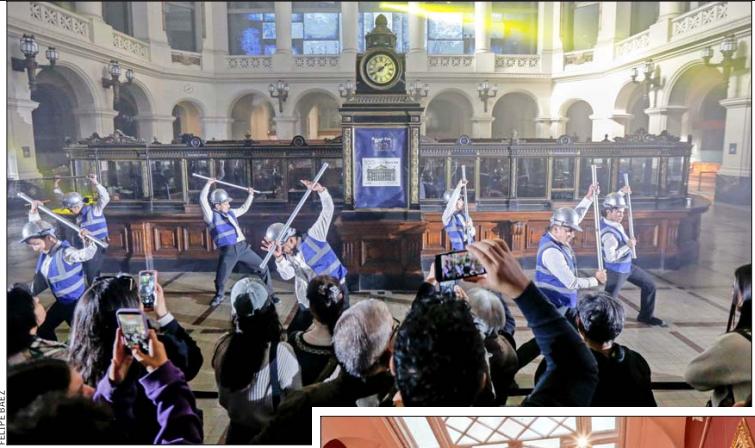
El Banco Central abrió sus puertas con recorridos por la oficina de la presidencia, la Sala del Consejo y su Museo Numismático, que exhibe monedas chilenas desde el siglo XVIII.

La instancia ya suma 27 años de historia: