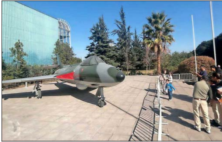
El Museo Nacional Aeronáutico y del Espacio volvió a exhibir el avión Hawker Hunter retirado para la conmemoración de los 50 años del golpe de Estado.