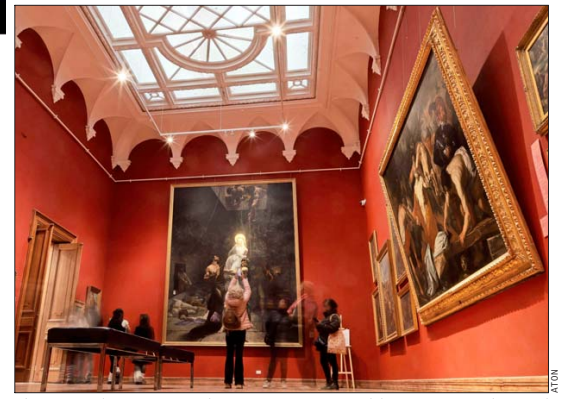
El Museo Palacio Vergara abrió sus puertas en Viña del Mar con recorridos por el histórico edificio y actividades sobre el patrimonio de la ciudad.