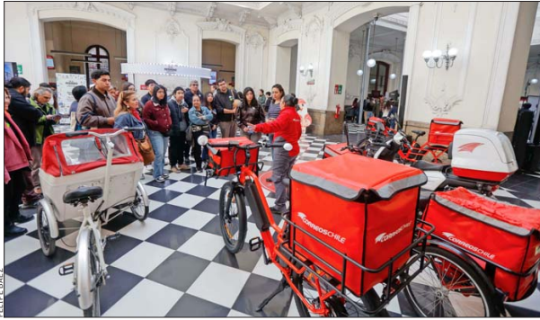
Correos de Chile abrió las puertas del histórico Correo Central, invitando a recorrer su edificio patrimonial, recientemente restaurado.