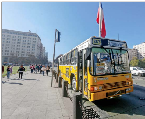
Las micros amarillas volvieron a las calles con paseos gratuitos desde el metro Quinta Normal a través de las principales calles de Santiago.