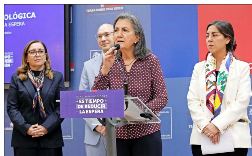
MEDIDA.— La alerta oncológica, vigente desde mediados de abril, será uno de los puntos clave en el discurso del mandatario. Se busca acelerar la atención retrasada de más de 33 mil pacientes.

anunciado en primera instancia, si equivale a más de $417 mil millones, un 2,5%. Por lo mismo, una de las preocupaciones es la situación presu-