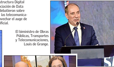
El ministro de Obras Públicas, Transportes y Telecomunicaciones, Luis de Grange.