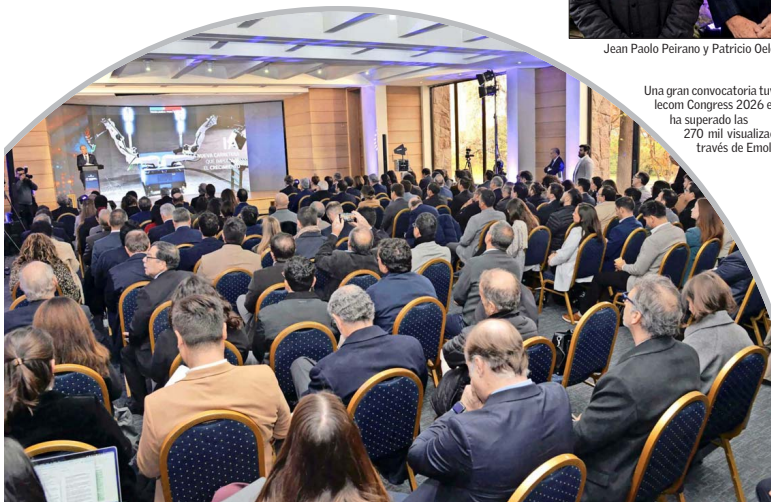
Una gran convocatoria tuvo el Telecom Congress 2026 el que ya ha superado las 270 mil visualizaciones a través de Emol TV.