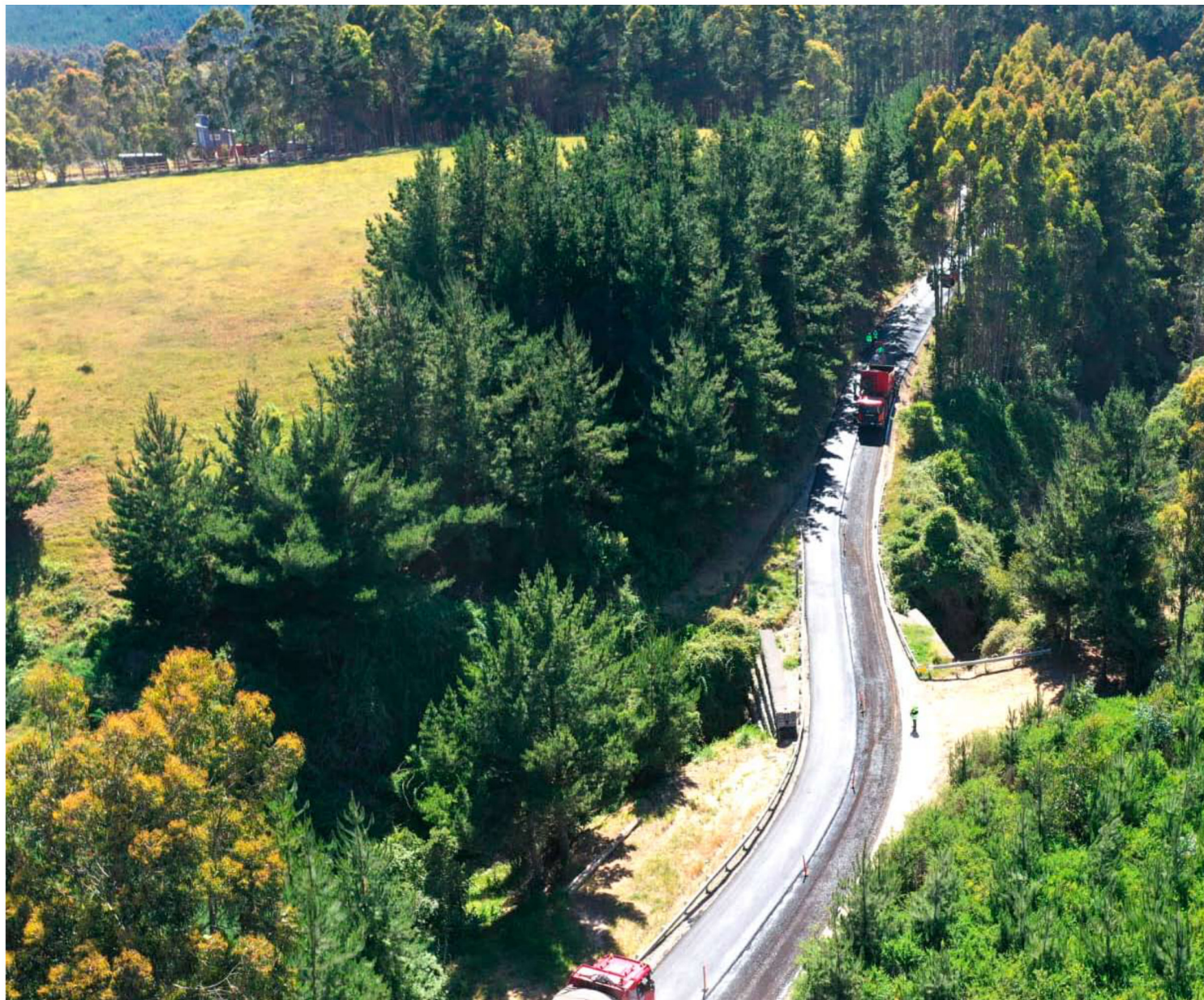
En noviembre culminaron las obras de la pavimentación por cerca de 5 kilómetros en la Ruta N-42, entre la entrada sur del puente Colmuyao hacia la localidad de La Orilla.

FELIPE AHUMADA JEGO fahumada@ladiscusion.cl