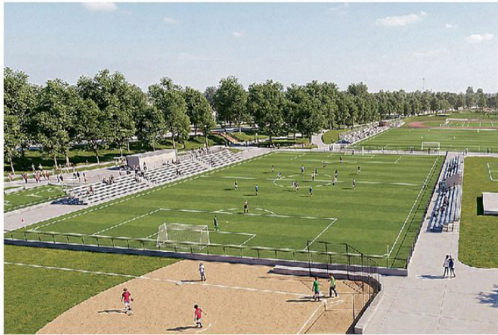
LA REMODELACIÓN DEL PARQUE DYR INCLUYE NUEVAS INSTALACIONES PARA LA PRÁCTICA DEPORTIVA.

oportunidades para potenciar la empleabilidad y el desarrollo de nuestros estudiantes y comunidades en general”.