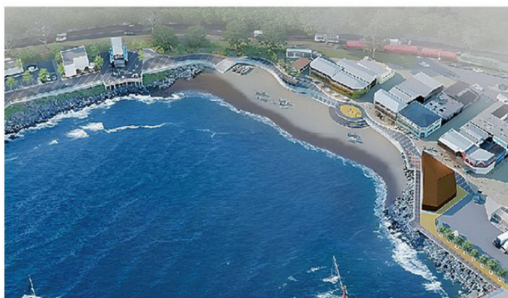
EL PROYECTO TAMBIÉN EJECUTARÁ UN PLAN DE MEJORAMIENTO DE LA PLAYA PACHECO ALTAMIRANO.

hectáreas de paseos y parques se construirán como compensación a la comunidad.