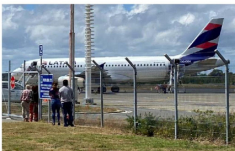
SE PROYECTAN DOS MANGAS DE ACCESO EN LA INICIATIVA.

EL TERMINAL DE PASAJEROS AUMENTARÍA SU CAPACIDAD CON EL PROYECTO QUE SE EJECUTARÍA EN EL AERÓDROMO MOCOPULLI, COMUNA DE DALCAHUE.