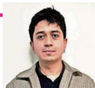
Por Sebastián Gutiérrez. Académico Facultad de Medicina Veterinaria y Agronomía Universidad de Las Américas

H ace aproximadamente 9.000 años, en algún rincón del Medio Oriente, un grupo de pastores comenzó a consumir la leche de los animales que había domesticado. Este gesto, aparentemente simple, moldeó civilizaciones, definió dietas y acompañó a la humanidad en cada etapa de su desarrollo. Desde entonces, la leche no ha dejado de estar presente: es el primer alimento que recibe un ser humano al nacer y uno de los más completos que la naturaleza ofrece a lo largo de la vida.