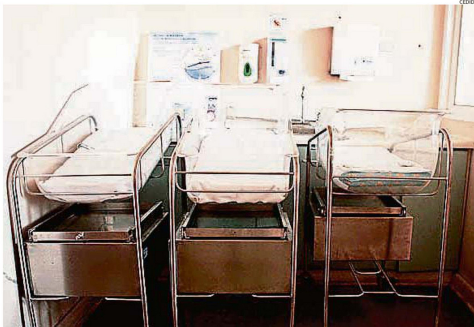
EL DESCENSO SOSTENIDO DE LOS NACIMIENTOS Y EL AUMENTO DE LA ESPERANZA DE VIDA ESTÁN MODIFICANDO LA ESTRUCTURA DE LA POBLACIÓN REGIONAL, FENÓMENO QUE YA IMPACTA A LA MAYORÍA DE LAS COMUNAS DE ÑUBLE.

En contraste, San Fabián figura entre las pocas comunas que todavía mantienen crecimiento posi-