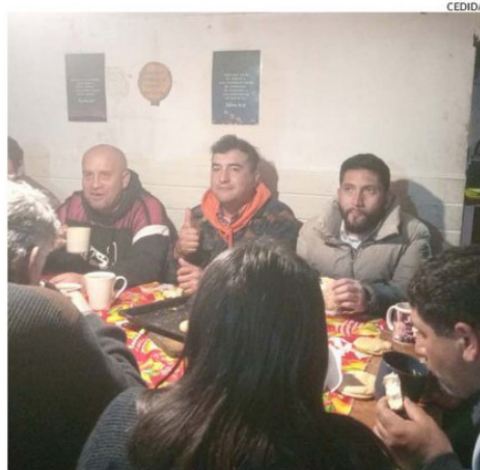
EL COMEDOR ABIERTO "MATÍAS MI BENDICIÓN" EN PUERTO MONTT.