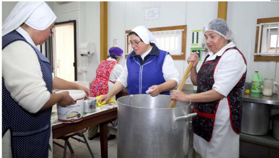
LA "OLLA SOLIDARIA SANTA MARÍA JOSEFA", EN RAHUE ALTO, DEPENDE DE LAS DONACIONES PARA PREPARAR LOS ALMUERZOS QUE ENTREGAN.

"En estos días tenemos una mayor demanda, porque las raciones que entregamos son 200, pero físicamente en el comedor llegan alrededor de 130 personas a comer acá. El resto viene a buscar comida en sus ollas para compartir con sus familias. Acá los comensales corresponden en un 30% a perso-