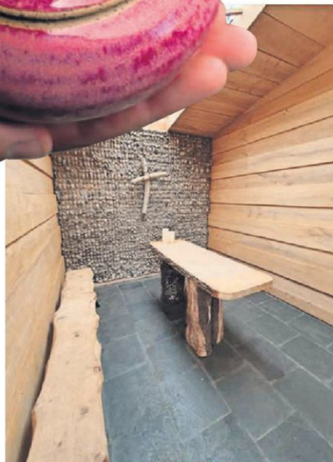
OFRECER RESPETO Y DIGNIDAD ES LO QUE BUSCAN ESTOS SERVICIOS.