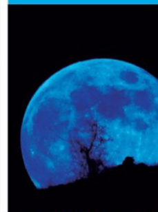
POR CHRISTIAN NITSCHHELM

T odavía en su fase gibosa creciente hoy, la Luna alcanza su fase Luna Llena mañana domingo 31 de mayo, a las 4:45 (horario chileno legal de invierno). Como es la segunda Luna Llena de este mes, tenemos lo que se llama Blue Moon (Luna Azul, aún si no tiene ningún color azul). Durante la próxima semana, la Luna estará en su fase gibosa menguante. Al nivel de los planetas del Sistema solar, Mercurio se puede observar dentro de las luces del atardecer, mientras tanto el planeta Venus, resplandeciente, se ubica mucho más arriba, con Júpiter bien visible un poco encima de Venus. Por otra parte, podemos observar a Neptuno y Saturno, más arriba, y Marte, más abajo, durante las últimas horas de la noche. Finalmente, Urano permanece invisible durante toda la semana.