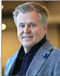
Holger Paulmann , presidente de Icare.

Desde el Instituto Chileno de Administración Racional de Empresas (Icare), Holger Paulmann está dejando su cargo para dar paso a Renzo Corona. En su último mensaje de cara al Gobierno, plantea expectativas más bien acotadas.