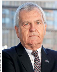
Alfredo Echavarría , presidente de la CChC.

En la Cámara Chilena de la Construcción (CChC), su presidente, Alfredo Echavarría, espera "un fuerte énfasis en aquellas medidas que permitan recuperar el crecimiento económico y generar más empleo formal. Chile acumula ya 40 meses con una tasa de desempleo superior al 8%, una situación que afecta directamente a miles de familias y que requiere acciones decididas para impulsar la inversión y la actividad económica". En este sentido, más allá de medidas completamente nuevas, dice, "una señal positiva sería reforzar y proyectar aquellas políticas públicas que ya han demostrado resultados concretos y un uso eficiente de los recursos fiscales". Se refiere al subsidio sobre la tasa de interés para créditos hipotecarios, y plantea que "una noticia muy bien recibida sería la extensión de la ley de subsidio a la tasa hipotecaria. Esta iniciativa ha permitido que miles de familias accedan a financiamiento para la compra de una vivienda, al mismo tiempo que ha contribuido a reducir el stock habitacional disponible".