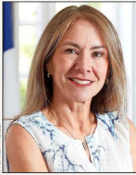
Susana Jiménez , presidenta de CPC.

Para la presidenta de la Confederación de la Producción y del Comercio (CPC), Susana Jiménez, el deterioro de los indicadores económicos es un factor de preocupación, y por eso espera "anuncios que permitan generar mejores condiciones para crecer, invertir y crear empleo. La última cifra de desempleo, que alcanzó 9,1%, hace imperativo avanzar en medidas que reactiven la inversión y permitan recuperar dinamismo económico. Hoy la principal urgencia es volver a generar oportunidades laborales para las cerca de 950 mil personas que buscan trabajo y también para los 2,5 millones de trabajadores que se desempeñan en la informalidad". En este sentido, sostiene que lo más relevante será "avanzar en medidas que impulsen la competitividad del país. Una reducción del impuesto corporativo hacia niveles más alineados con los estándares internacionales y una agenda decidida para agilizar los permisos sectoriales y ambientales pueden ayudar a destrabar proyectos, atraer inversión y generar más empleo".