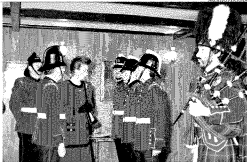
La princesa Ana de Inglaterra visitó la Compañía Británica de Bomberos en 1994. José Zagal a la derecha, con su gaita.