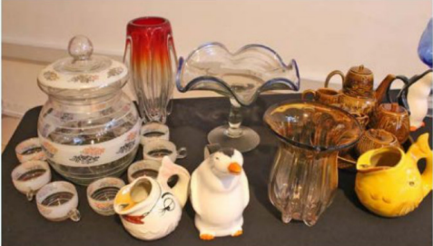
Piezas antiguas que forman parte del patrimonio de Rancagua se exhibieron este sábado en el Marcela Paz.