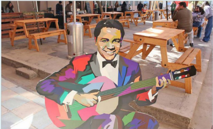
Cultores, emprendedores y músicos se dieron cita en los amplios espacios del antiguo Colegio Marcela Paz de Rancagua.