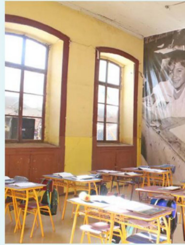
Una de las aulas habilitadas del Marcela Paz para esta celebración.