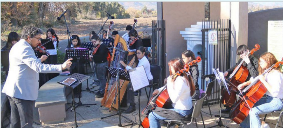
Una de las grandes atracciones en Machalí fue la presentación de la Orquesta Juvenil Municipal en el Cristo de la Hacienda.