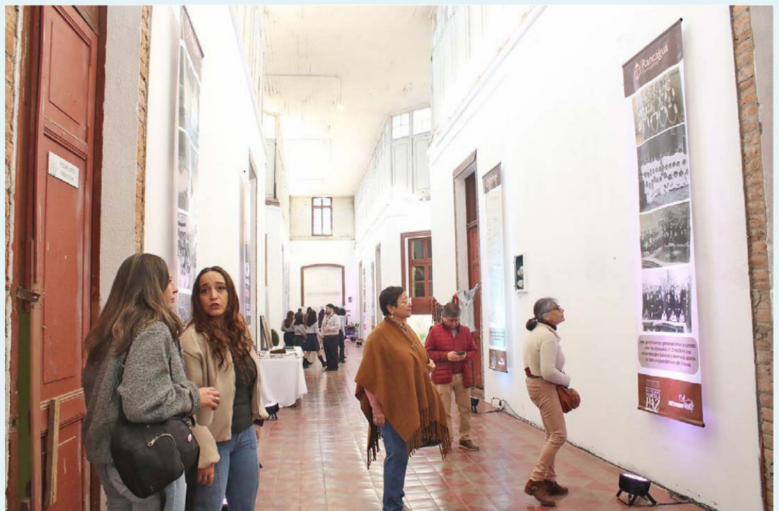
El antiguo Colegio Marcela Paz recibió a gran cantidad de público en el Día del Patrimonio.