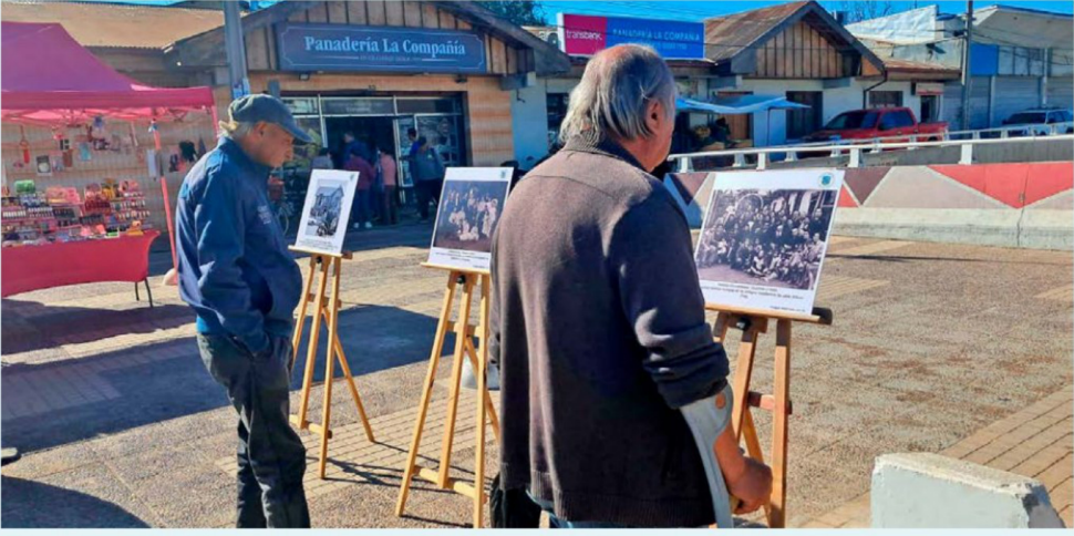
Los granerinos disfrutaron de las actividades organizadas por la municipalidad.