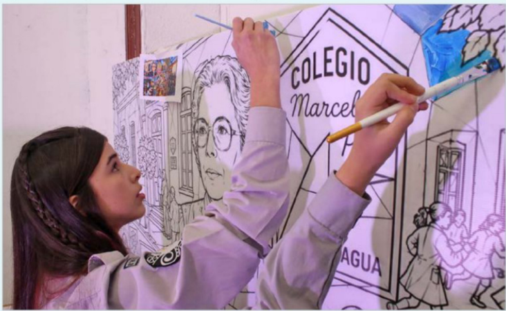
La pintura formó parte del entretenimiento de los niños en las actividades programadas en el Día del Patrimonio en Rancagua.