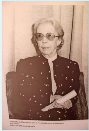
Una fotografía de Marcela Paz (Esther Huneus Salas) llamó poderosamente la atención de los asistentes al colegio que lleva su nombre.