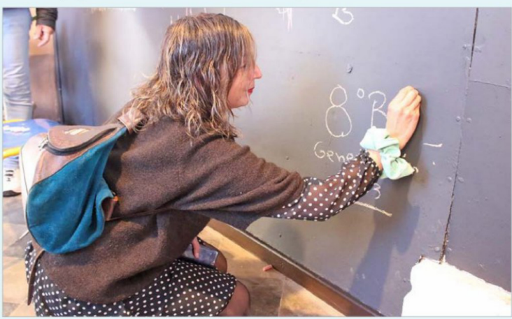
Ex alumnas del Colegio Marcela Paz estamparon su mensaje en esta fecha tan especial para el patrimonio de la ciudad.