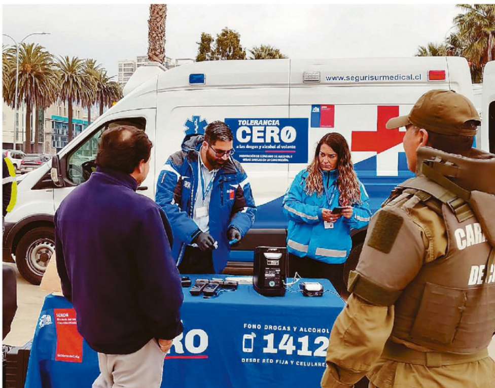
LA FISCALIZACIÓN OBLIGATORIA POR PARTE DE LAS EMPRESAS BUSCA COMPLEMENTAR LOS CONTROLES ALEATORIOS EN LA VÍA PÚBLICA.