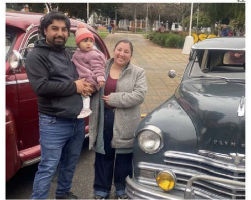
UNA PAREJA JUNTO A SU HIJA DISFRUTANDO DE LA CULTURA.

“Esta muestra de automóviles es una maravilla. Uno se toma fotografías con todos los vehículos y los niños son quienes más disfrutan, aunque los que somos aficionados a los motores también estamos felices. Me llama la atención lo ordenados que están los recorridos y cómo en cada recinto existen actividades. Todo está muy bien cuidado. Osorno es una ciudad muy bonita, pero siento que se difunde poco todo lo que tiene para ofrecer. Por ejemplo, visitamos varios museos solamente porque revisamos el programa del Día del Patrimonio”, señaló.