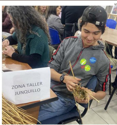
DISTINTOS TALLERES SE REALIZARON EN LA PINACOTECA Y BIBLIOTECA.

Día de Los Patrimonios, para abarcar las distintas culturas y tradiciones presentes en el país. Continuará realizándose el último fin de semana del mes de mayo.