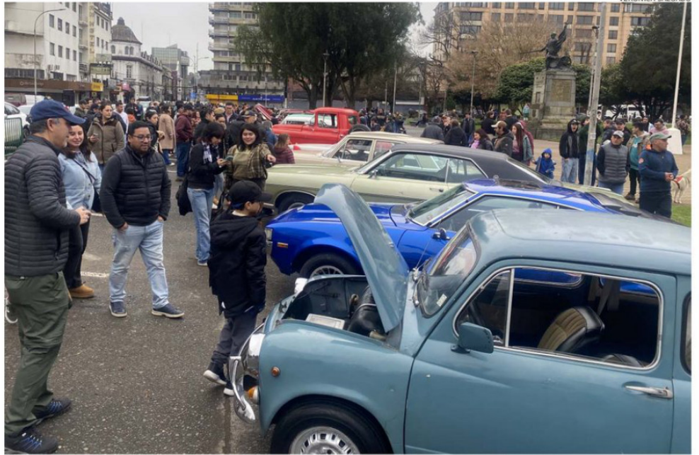
LA EXHIBICIÓN DE AUTOMÓVILES ANTIGUOS REALIZADA AYER EN LA PLAZA DE ARMAS FUE DE LAS VISITADAS DURANTE EL FIN DE SEMANA.

OSORNO. Decenas de personas visitaron museos, bibliotecas, entre otros recintos abiertos el sábado y domingo, además de participar en actividades artísticas. La muestra de autos antiguos en la plaza de Armas fue una de las más visitadas y disfrutadas por grandes y chicos. Los asistentes destacaron la oportunidad de recorrer los espacios históricos en familia y la preocupación por ofrecer un nutrido programa.