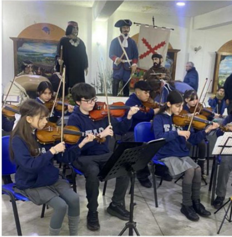
LA BANDA DE LA ESCUELA DE LAS ARTES EN EL FUERTE REINA LUISA.