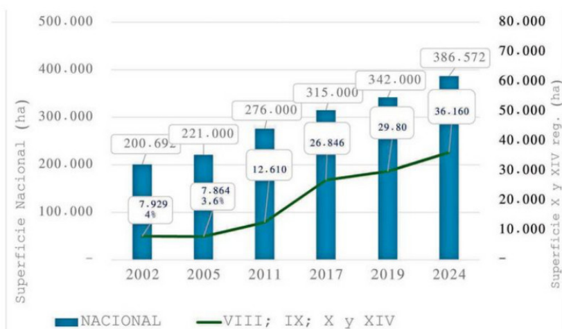
Gráfico: Tendencia de Crecimiento de la superficie frutícola plantada a nivel nacional v/s zona sur (VIII; IX; X y XIV reg.)