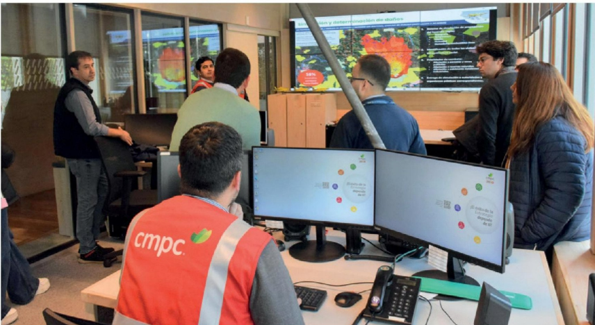
LA SALA DE CONTROL DE INCENDIOS permite monitorear emergencias forestales y coordinar recursos destinados a su combate en distintos puntos del país.

No están presentes en Chile durante el invierno, porque están circulando permanentemente los 365 días del año. Durante el invierno chileno trabajan en el hemisferio norte y durante el verano del hemisferio sur están combatiendo incendios en Chile.