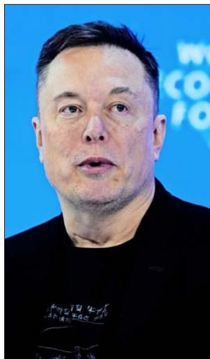
Elon Musk dirige SpaceX.

La presentación podría poner a la compañía detrás de Claude en camino a salir a bolsa este otoño.