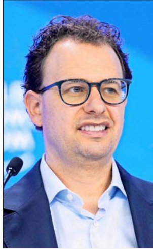
Dario Amodei, CEO de Anthropic.

La compañía, fundada en 2021 por un grupo de exempleados de OpenAI, incluido el actual CEO de Anthropic, Dario Amodei, fue alguna vez una rival menor y combativa respecto de la cual los inversionistas no estaban seguros de que pudiera adelantarse al creador de ChatGPT. Eso cambió con el lanzamiento de productos