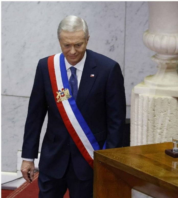
► En general no hubo mayores interrupciones en la alocución.