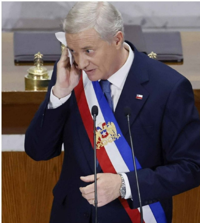
► Los 144 minutos del discurso lo ubican en un tiempo de duración promedio.