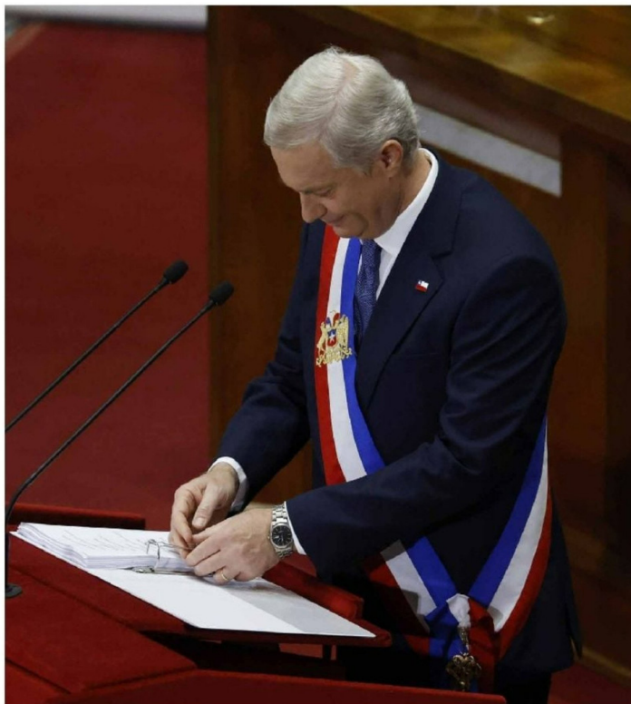
► El Presidente también dio a conocer nuevos bonos.