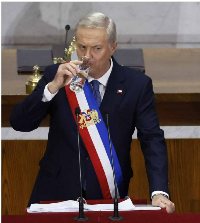
► También hubo anuncios en cuanto a fusión de ministerios.