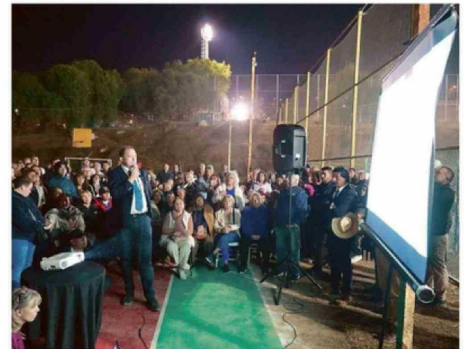
LA REUNIÓN CONVOCÓ A CIENTOS DE VECINOS DE EL OLIVAR.