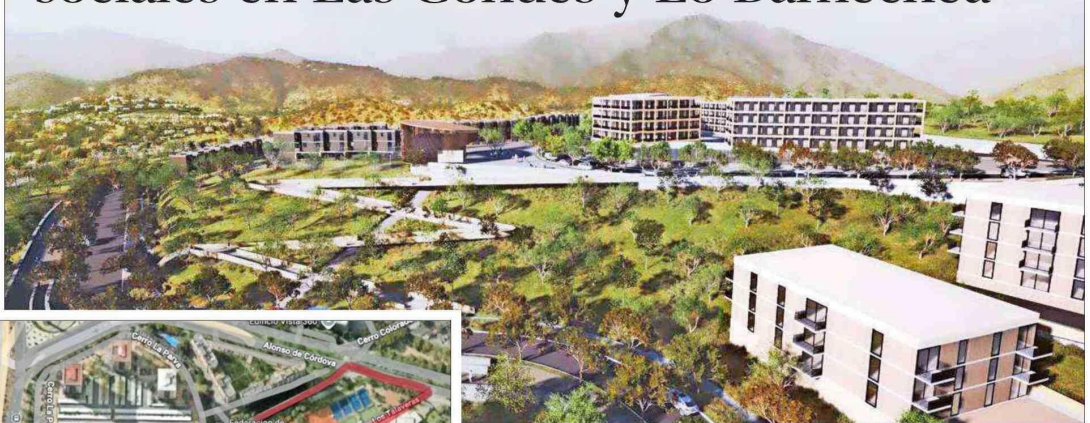
El render del proyecto "Vistas del Águila" que se levantaría en Lo Barnechea.