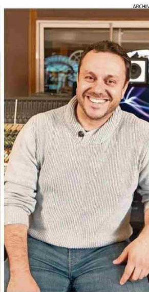
EL COMPOSITOR PATRICK MOORE.