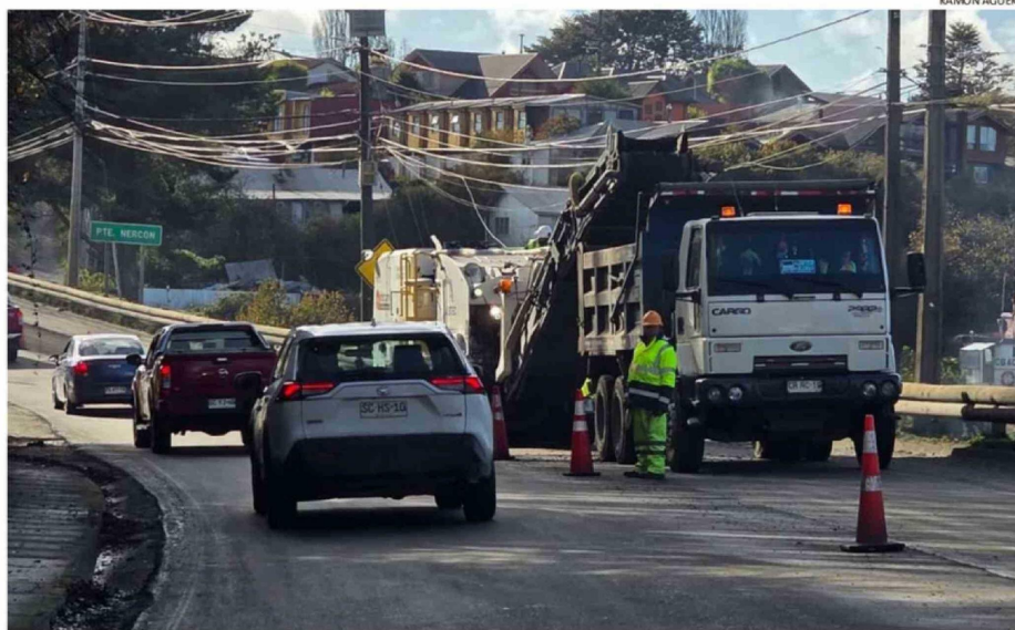
EN EL SECTOR DEL PUENTE DE NERCÓN SE ESTÁN EJECUTANDO TRABAJOS EN LA RUTA 5 SUR.