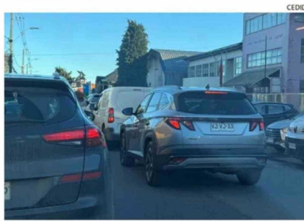
LOS ATOCHAMIENTOS INCLUSO SE HAN VISTO EN EL CENTRO.

se están ejecutando son trabajos que se debían hacer y consideraría la última parte para posteriormente avanzar hacia Chonchi.