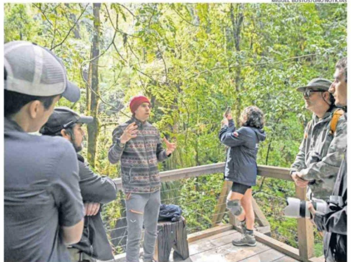
PIRINEL ES UN PROYECTO SIN FINES DE LUCRO. EL PARQUE ESTÁ ABIERTO AL PÚBLICO DESDE EL 14 DE FEBRERO DE ESTE AÑO, PERO EN MODALIDAD DE MARCHA BLANCA.