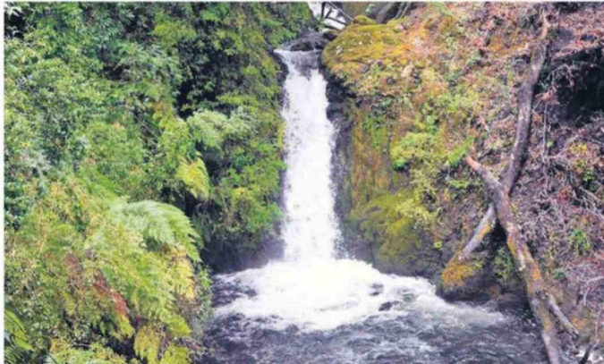
LA CASCADA PIRINEL ES UNO DE LOS ATRACTIVOS DEL PARQUE.

Un propósito del parque es destinar las tierras a la ciencia y la conservación. Así fue diseñado en su origen. Durante cuatro años estudiaron la zona. "Partimos inicialmente con científicos, viendo cuáles eran los valores ecológicos y viendo cuál era la estrategia de conservación que debería haber. Yo diría que algo que caracteriza este proyecto ha sido la perseverancia y la cautela que hemos tenido para entender cuál es el rol que queremos cumplir y