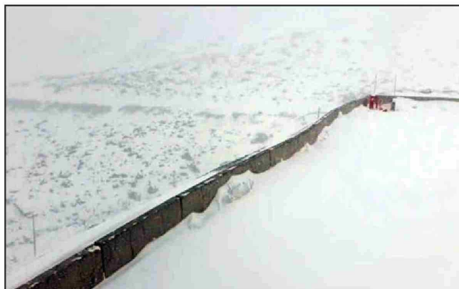
Gran cantidad de nieve ha caído en la Cordillera de Los Andes.

cabuco en coordinación con el delegado presidencial de la provincia de Chacabuco».