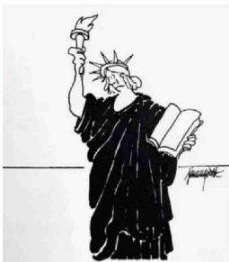
Dolor. 12/09/2001 "Aterrorador ataque a Estados Unidos". El Mercurio.