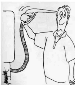
Alza. 12/01/2002. "Entre $ 6 y $ 12 por litro suben las bencinas". El Mercurio.