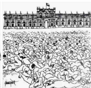
El lente de Tunick 01/07/2002 "Masiva sesión fotográfica en Santiago: Tunick desnuda el mito de un país pacato". El Mercurio.