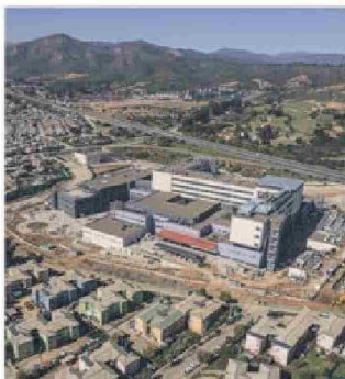
El edificio beneficiará a cerca de 490 mil personas no sólo de Villa Alemana, sino también a vecinos de las comunas aledañas.

Desde el Servicio de Salud Viña del Mar-Quillota-Petorca destacan el avance de las obras en los plazos comprometidos: "Acciona ha demostrado un compromiso constante con el proyecto, avanzando físicamente según los plazos establecidos con los ajustes propios de una obra importante como los es un recinto de salud de alta complejidad. Este