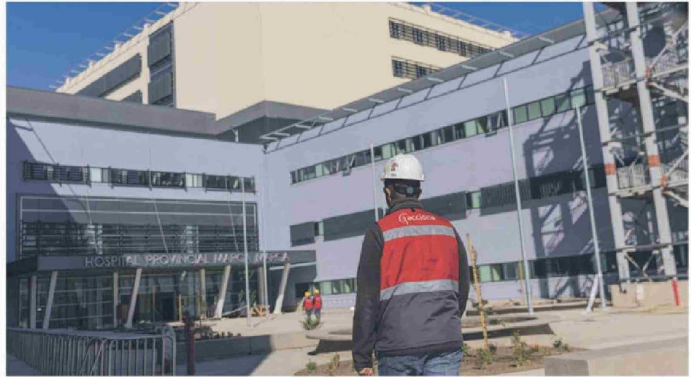
Se espera que los más de 75 mil metros cuadrados que conforman el hospital estén operativos después de mayo de 2025.

"Es un gran logro, por las diversas dificultades que el proyecto enfrentó desde la etapa de diseño y durante la construcción, como la pandemia, el alza de los precios de los mate-