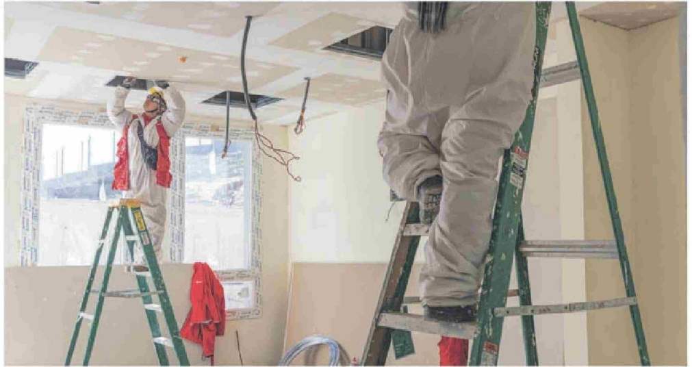
Esta fue la primera obra en América Latina que tuvo a una cuadrilla 100% femenina a cargo de levantar uno de los edificios que hoy le dan forma al hospital.

levantamiento: fue la primera obra en América Latina que tuvo a una cuadrilla 100% femenina a cargo de levantar uno de los edificios que hoy le dan forma: la sala cuna para los hijos de sus trabajadores.