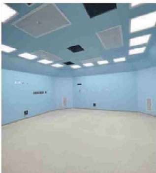
Marga Marga tendrá operativos nueve pabellones quirúrgicos,

El hospital es una infraestructura que no sólo marcará un hito a nivel de construcción; también a nivel de gestión del trabajo para su