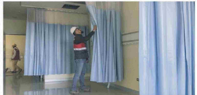
32 boxes médicos tendrá el hospital. Además, 14 boxes de urgencia y atención en 37 diferentes prestaciones de salud; entre ellas, kinesiología, odontología y psiquiatría.