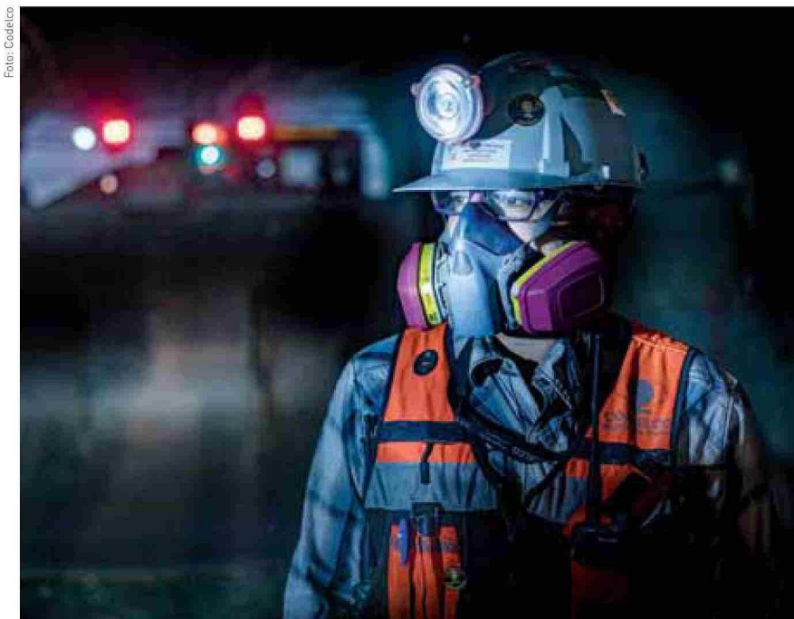
Para el presidente de la Alianza Minera, se debe hablar de extracción ilegal de minerales como la actividad ilícita y no de minería ilegal, porque la minería es una actividad formal, con reglas establecidas.

Mi visión es que todos somos parte de este libre mercado, las condiciones