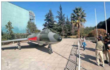
El Museo Nacional Aeronáutico y del Espacio volvió a exhibir el avión Hawker Hunter retirado para la conmemoración de los 50 años del golpe de Estado.