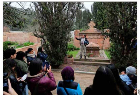
El Cementerio Santa Inés abrió sus puertas en Viña del Mar con recorridos por sus espacios históricos, destacando relatos y personajes de la ciudad.