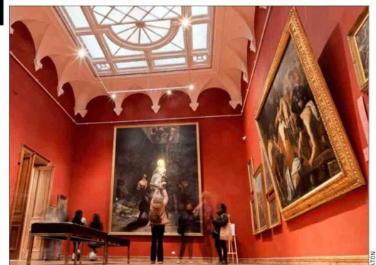
El Museo Palacio Vergara abrió sus puertas en Viña del Mar con recorridos por el histórico edificio y actividades sobre el patrimonio de la ciudad.

Con más de 4.000 actividades disponibles en esta ocasión a lo largo del país, la celebración se extenderá hasta hoy con recorridos, exposiciones y la apertura de espacios.