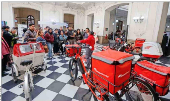
Correos de Chile abrió las puertas del histórico Correo Central, invitando a recorrer su edificio patrimonial, recientemente restaurado.