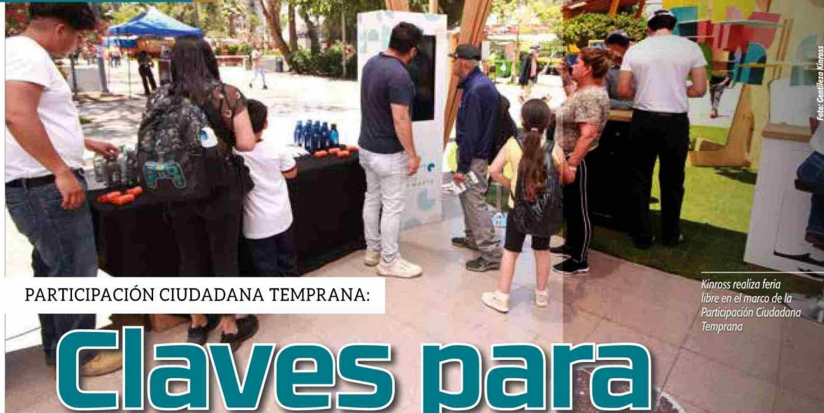
PARTICIPACIÓN CIUDADANA TEMPRANA:

Kinross realiza feria libre en el marco de la Participación Ciudadana Temprana