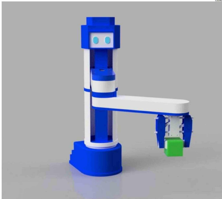
LA MANITO-RENDER, PROYECTO DESARROLLADO EN LA USS.

"Manito" es un brazo robótico diseñado para interactuar con niños y niñas desde los 4 años, a través de la resolución de actividades didácticas. Pensado especialmente para la primera infancia, el dispositivo se