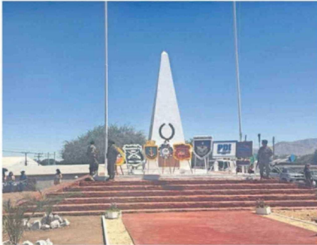
MONOLITO DE TOPATER, DONDE OCURRIÓ EL COMBATE.

Esta semana Calama conmemoró su 147 aniversario, y recordamos la lista de enseres con lo que contó el grupo de civiles bolivianos que resistieron la toma de la comuna.