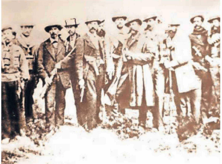
FOTOGRAFÍA DE UNA RECREACIÓN HISTÓRICA HECHA DE LA DEFENSA DE CALAMA, CON CABRERA Y ABAROA EN EL CENTRO. FOTO DE 1920.

Es en mi poder de su grata 15 del actual (fecha de la carta remitida por Cabrera) en la cual me solicita junto con otros vecinos de Calama una contribución para la alimentación de los rifles que defenderán el pueblo cuando ataquen los de Caracoles (localidad ya desaparecida donde se estacionaba parte del ejército de Chile). Mi hermano Ignacio y mi familia quere-