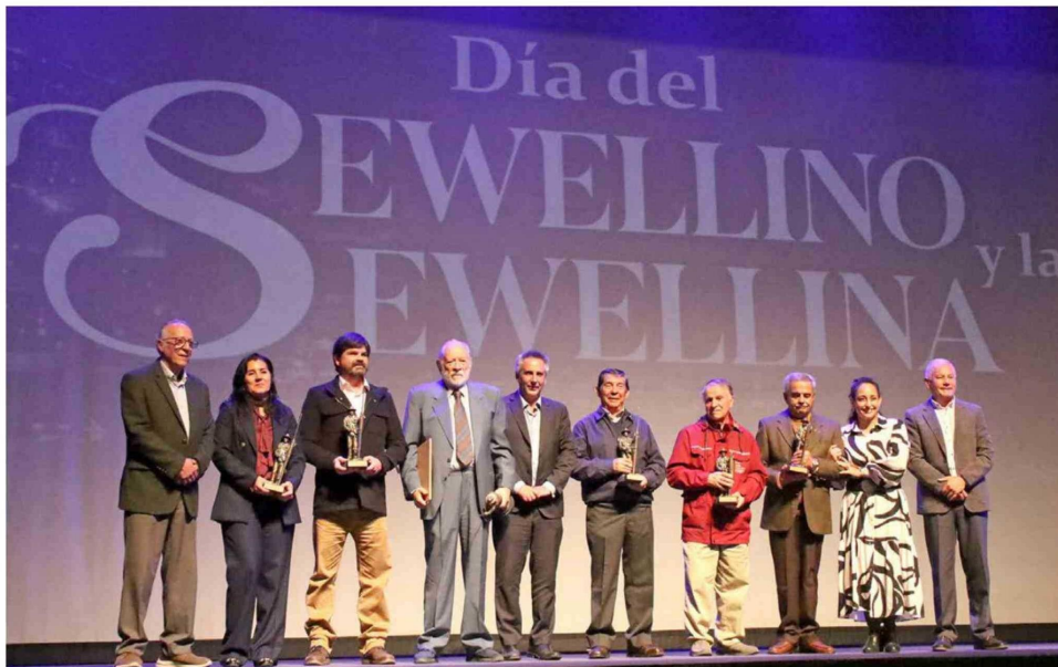
Durante la ceremonia se reconoció a destacados Sewellinos y Sewellinas por su contribución a la preservación de la memoria histórica de Sewell.